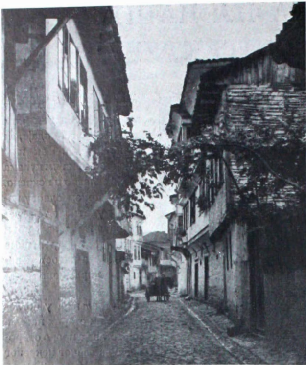
УЛИЦА У СТРУЗИ