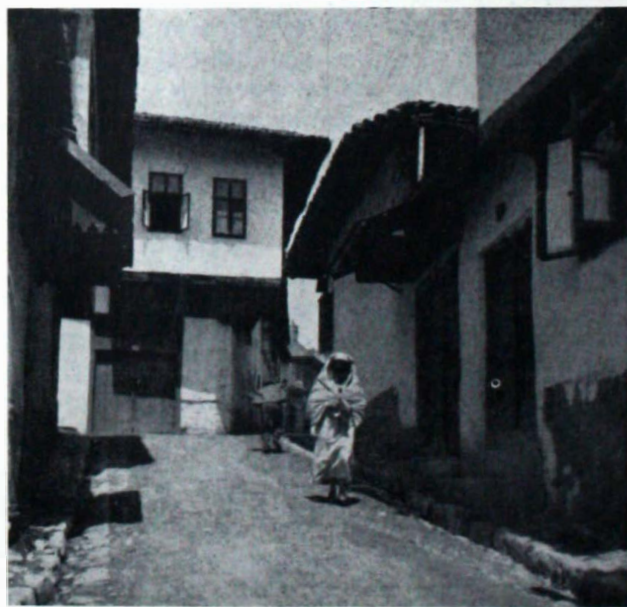
УЛИЦА У САРАЈЕВУ