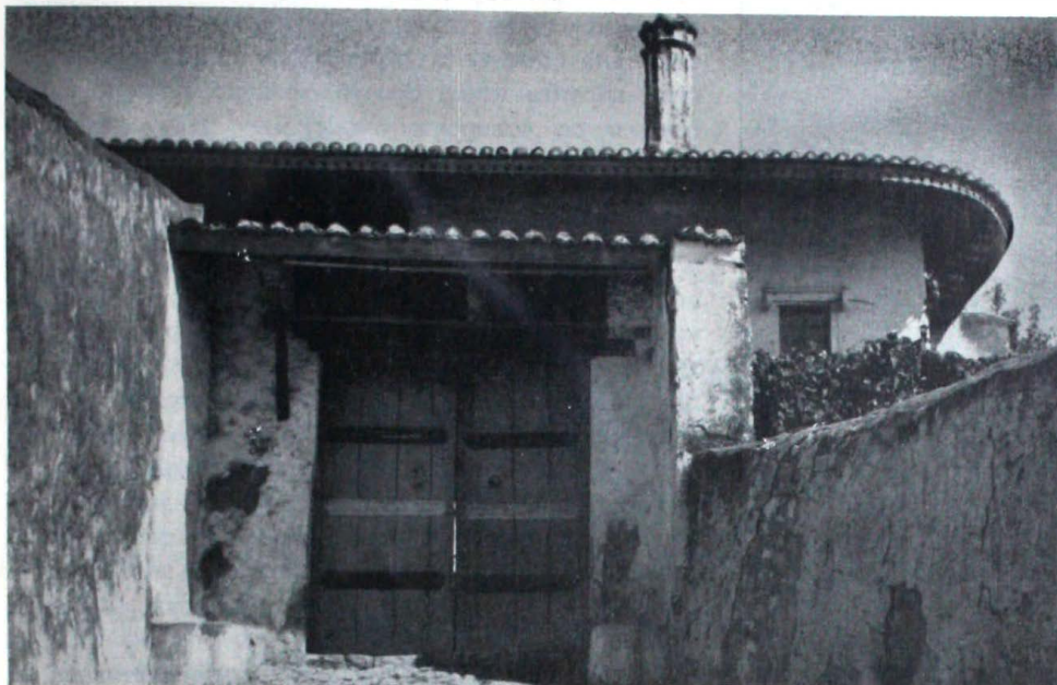
КУЋА У УЛЦИЊУ