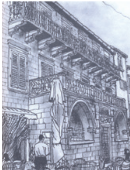
Slika 7. Aleksandar Radojević, Palata Pima u Kotoru (A. Radojević, Žapisi i crteži u prolazu , Podgorica 2009, 41)

kosovsko-metohijsku i crnogorsku baštinu. Njegovi crteži su disciplinovano precizni i prikazivački ilustrativni. (Slika 7) Umetnute ljudske figure podređuje prikazanoj arhitekturi. Opredeljen za statični prizor, izbegava kontraste i slobodu grafičkog izraza u korist odnegovane deskripcije. Crteže shvata kao dokumente stanja na terenu, dajući prednost analizi nad doživljajem. (Radojević 2003; Radojević 2006; Radojević 2009; Маневих и Гавриловић 2016)