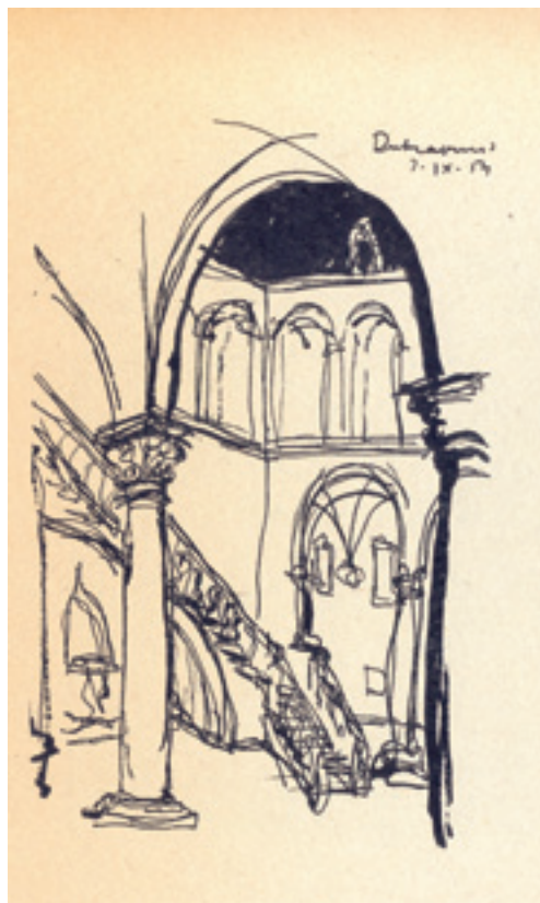
Slika 11. Svetislav Ličina, Dubrovnik 1954 ( Crteži 5, Beograd 1960)