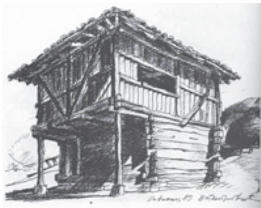
Slika 9. Zoran Petrović, Konak u Savincu (N. Vuletić, G. Babić, ur., Seoska i stara gradska naselja u delu Zorana B. Petrovića , Beograd 1997, 130)