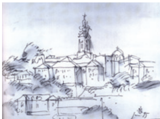
Slika 4. Branislav Milenković, Saborna crkva i savsko priobalje u Beogradu 1995 (B. Milenković, Žapisi: „Mesto nije mesto” , Beograd 2015, 3)