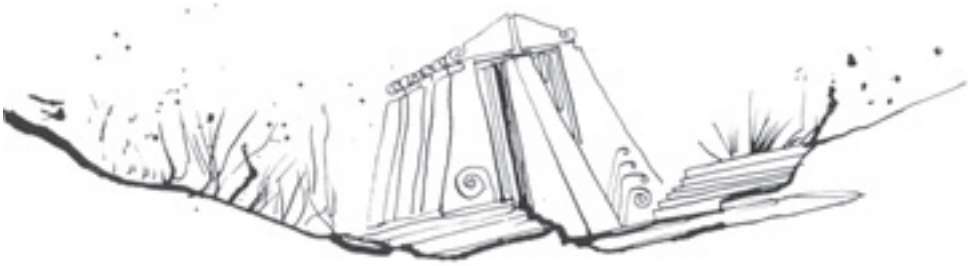
Slika 13. Bogdan Bogdanović, Mauzolej u Čačku (Mauzolej borbe i pobeđe protomajstora Bogdana Bogdanovića, tematski broj, Gradac 41, Čačak 1981, 39)