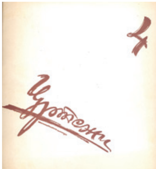
Slika 1. Naslovna strana časopisa Crteži (br. 4, Beograd 1959)