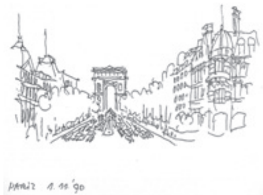
Slika 3. Mihajlo Mitrović, Trijumfalna kapija u Parizu, 1990 ( Arhitektura i urbanizam 3, Beograd 1996, 1)