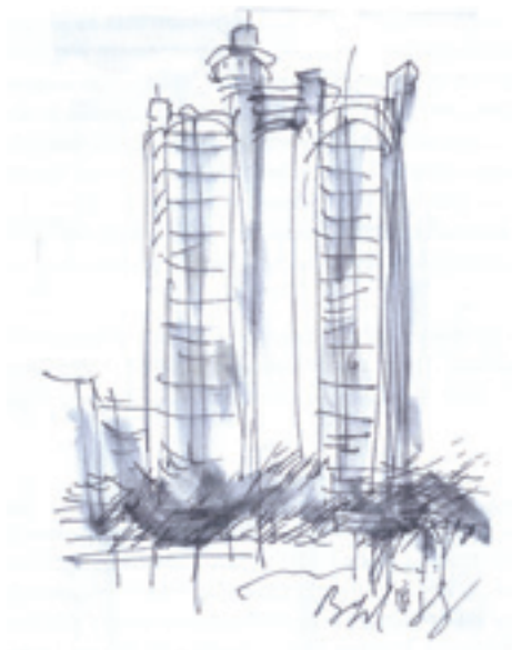
Slika 6. Branislav Milenković, Zapadna kapija Beograda (B. Milenković, Žapisi: „Mesto nije mjesto” , Beograd 2015, 13)