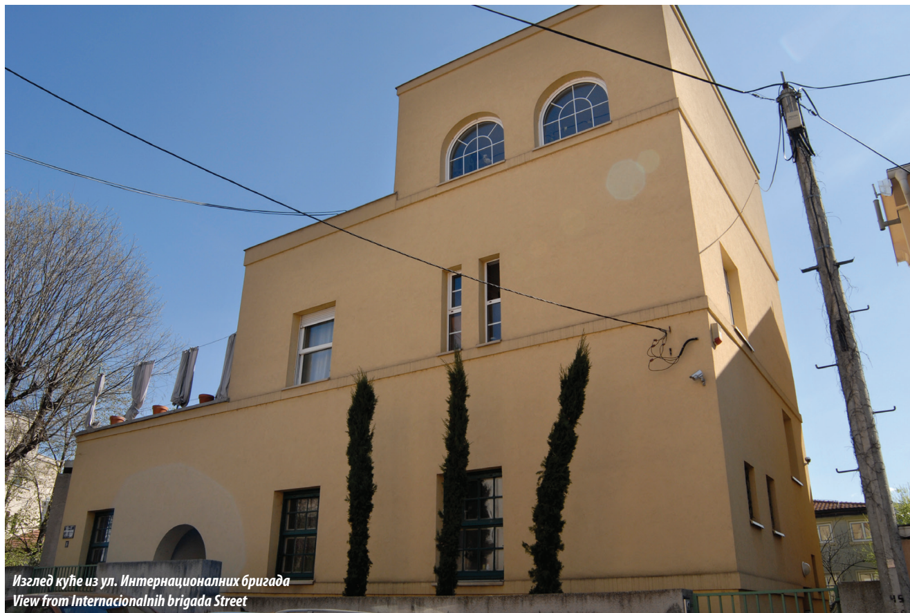
Изглед куће из ул. Интернационалних бригада View from Internacionalnih brigada Street