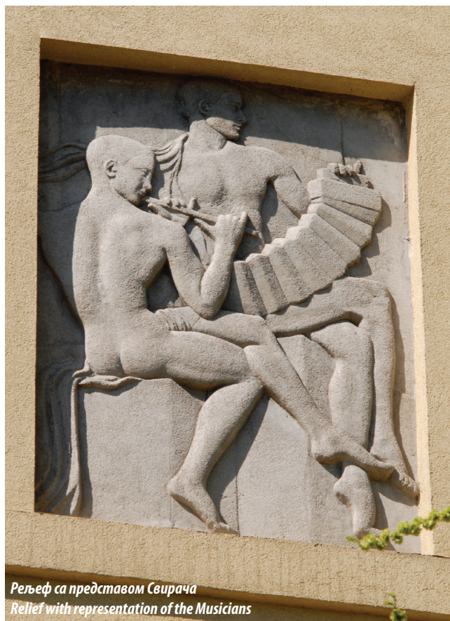
Релјеф са представом Свирача Relief with representation of the Musicians

Based on the geometry of the plot, the architect overlapped two tri-dimensional geometric structures, with practically no ornaments and with a balanced cubic form, as manifested by its dynamic nature and multiple cascades from various perspectives from both streets, and from the street corner itself, with the lower view from Janka Veselinovića Street being particularly striking. The original solution of the house's foundation and the cascade forms of stereometric structure with balanced proportions, which masterfully adjust the building to the structure of the terrain, was