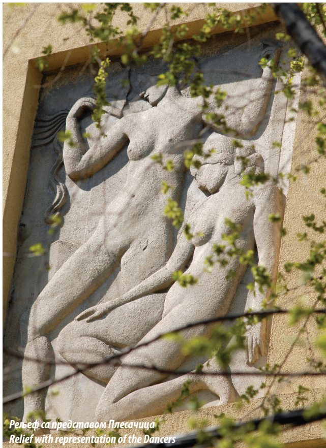
Релјеф са представом Плесачица Relief with representation of the Dancers

practice in Zloković's earlier designing stage. The plan of the foundation of the house, and the façade at Janka Veselinovića Street accentuate the position of the central room – lounge, through the grouping and framing of its windows. The geometry is contributed by simple horizontal cornices between floors and at the roof, as well as by the strictly geometric fence of the first-storey balcony. The jagged angular front of the house has no apertures. Both façades have architrave and arched apertures, while the façade at the upper street has windows with differing proportions. The architect designed a special type of window for this house, a vertical sliding window with counterweights, which can be found in all main rooms, and whose dimensions and proportions adhere to the golden ratio. The side façades have smaller windows, though they are dimensionally based on the primary window type. Zloković would go on to use this type of window